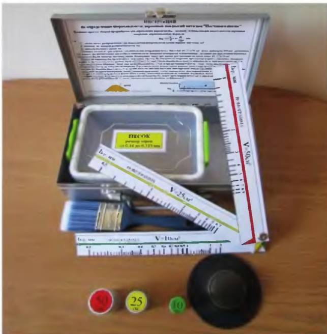
Рисунок 3 – Измерительное средство «Песчаное пятно»

7.1 В качестве измерительного оборудования следует использовать измерительное средство «Песчаное пятно» (см. Рисунок 3).